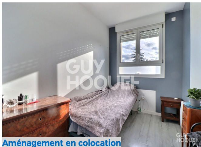
Aménagement en colocation