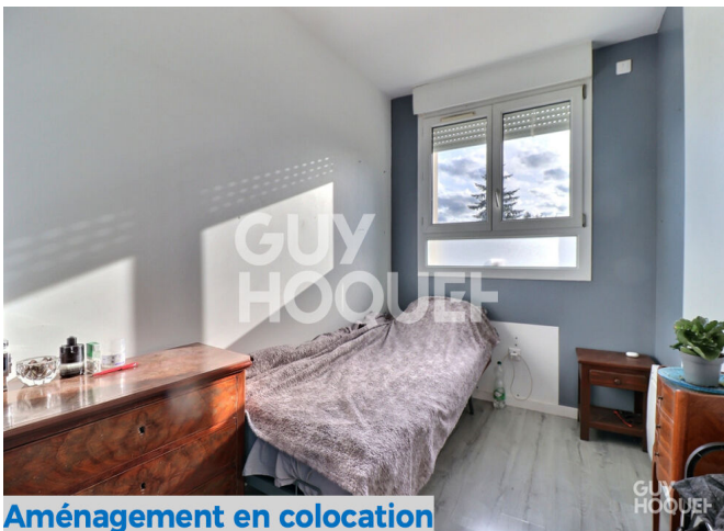
Aménagement en colocation