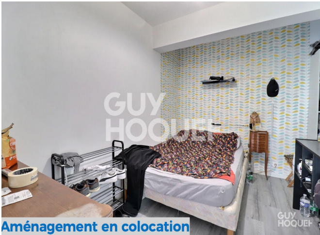
Aménagement en colocation