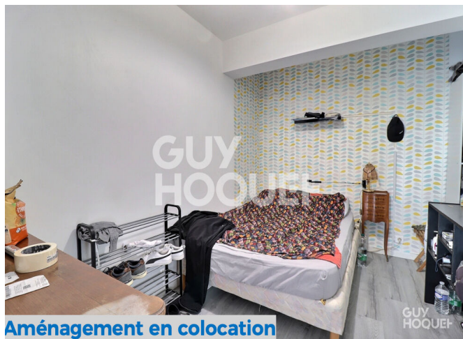
Aménagement en colocation