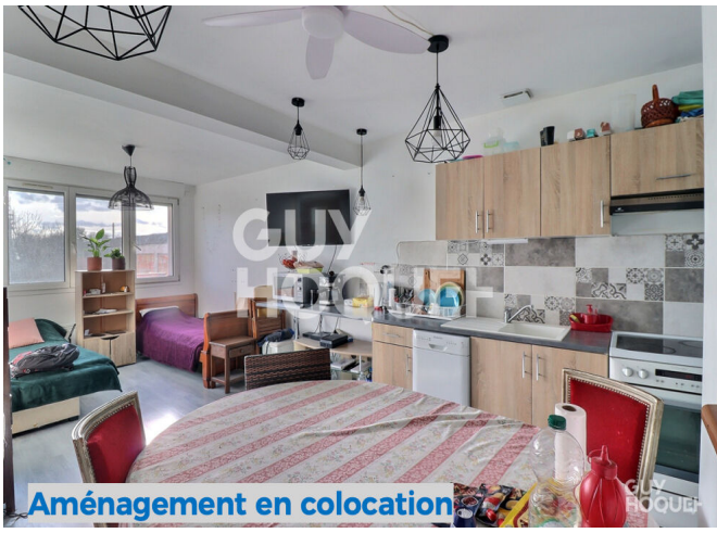
Aménagement en colocation